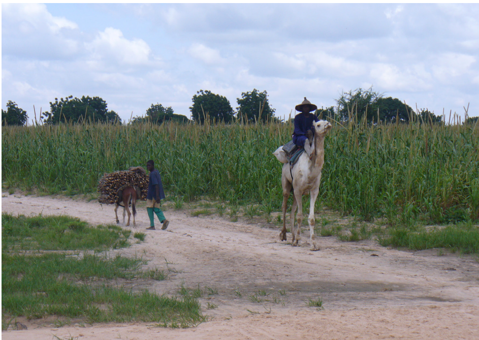
1. kép Cirokültetvény Zamfara államban Photo 1 Sorghum plantation in Zamfara State

kodás. A Világbank adatai szerint az ország területének mintegy 76,9-79,1%-a művelésre alkalmas földterület (The World Bank Group, 2015), ami az ország teljes területét figyelembe véve mintegy 70-73 millió hektárt jelent. Az ország tehát hatalmas mezőgazdasági potenciállal rendelkezik, ám e termőterületnek kevesebb, mint felén folyik művelés és a termelés hatékonysága a modernizáció hiánya miatt alacsony (1. kép). Nigéria lakossága emiatt jelentős, mintegy évi 6,4 milliárd USD értékű élelmiszerimportra szorul. Ez a kettősség már szinte kezdettől fogva fennállt. NWUFOH, F. C. (1986) tanulmányában rámutatott arra, hogy a mezőgazdasági termékek importja 1962 és 1982 között ötszörösére növekedett. A függetlenség elnyerésének évében, 1960-ban a mezőgazdaság a GDP 63,3%-át adta, míg húsz év múlva, 1980-ban már ennek csak egyötödét (20,5%). Hozzá kell tenni, hogy az idézett tanulmány megjelenésének idején Nigéria lakossága és élelmiszerigénye a mainak alig a fele volt.