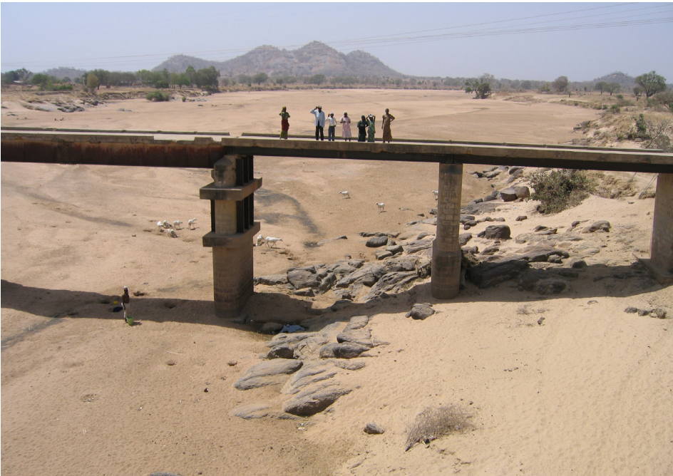
4. kép A száraz évszakban ideiglenesen kiszáradt folyómeder Sokoto államban Photo 4 Temporarily dry river-bed in Sokoto State during the dry season Forrás/Source: a szerző saját felvétele/own photo of the author (2009)