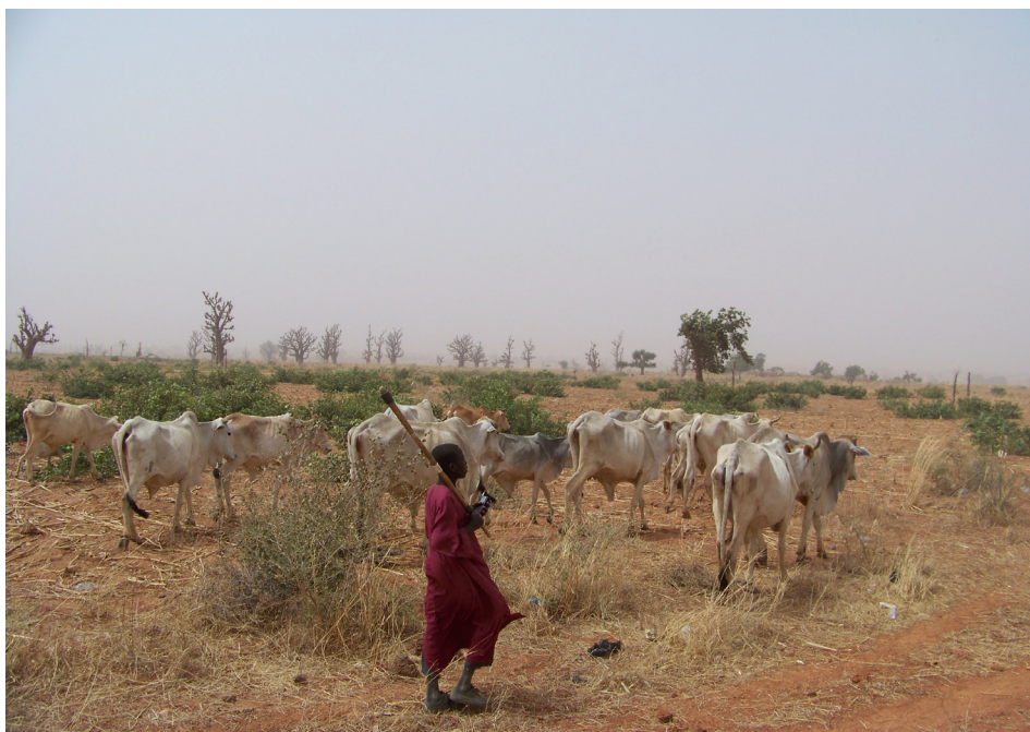
2. kép Életkép a félsivatagos Sokoto államban Photo 2 Everyday life in the semi desert area of Sokoto State

Nigéria területe, földrajzi elhelyezkedése okán, éghajlati szempontból folyamatos átmenetet képez a Szahara és az egyenlítői trópusi övezet között. Bár az ország területébe a Szahara teljesen terméketlennek mondható sivatagos részei (ma még) nem nyúlnak be, Nigéria legészakibb szegélye része a Száhel-övezetnek, amely egyre inkább terjeszkedik déli irányba (2. kép). Ennek következtében nagyon jelentős különbségek vannak az ország egyes régiói között, amely úgy népsűrűségben, mint például a mezőgazdasági potenciálban is tetten érhető.