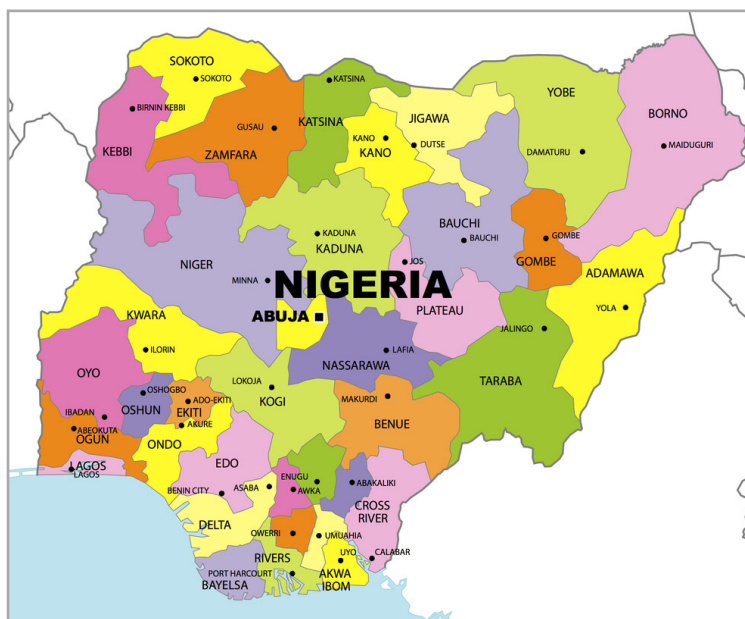
I. ábra A Nigériai Szövetségi Köztársaság közigazgatási térképe Figure 1 Political map of the Federal Republic of Nigeria

részen az etnikai-törzsi megoszlás jóval „tarkább”, az ország délnyugati államaiban nagyrészt a yoruba, míg délkeleti államaiban az igbo (ibó) és számos további nemzetség lakik.