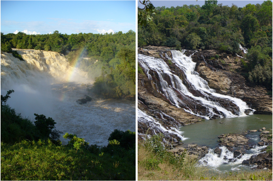
5. kép A Gurara vízesés a nedves és a száraz évszak idején Niger állam Photo 5 Gurara Falls (Niger State) during the wet and dry seasons

akadozzon. Ma azonban ez a jellemző helyzet, így nemcsak az intézmények, de a lakossági háztartások jelentős része is benzines áramfejlesztőt használ. A száraz és a nedves évszak okozta vízhozambeli különbséget jól láthatjuk az ország középső részén, a fővárostól mintegy 70 km-re északra lévő Gurara vízesés esetében (5. kép).