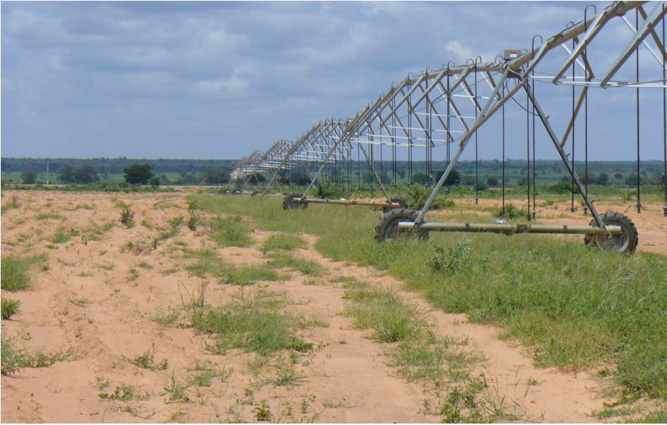
3. kép Használaton kívüli modern öntözőberendezés Zamfara államban Photo 3 Unused modern irrigation equipment in Tamfara State Forrás/Source: a szerző saját felvétele/own photo of the author (2009)