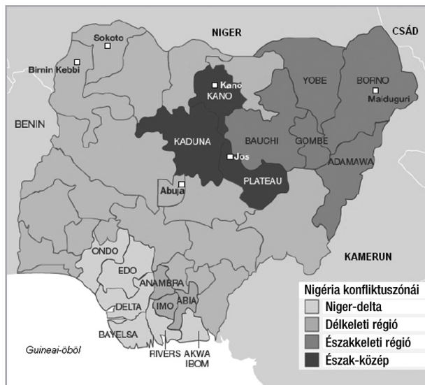
2. ábra Konfliktusövezetek Nigériában 2014

vidék békéjéért. Ennek is köszönhető, hogy az utóbbi néhány évben e szervezetek erőszakos tevékenysége visszaesett, bár kérdéses, hogy mikor lángol fel újult erővel a küzdelem, ha a jövedelemelosztásban, illetve ebből következően az helyi életkörülményekben nem történik érdemi változás.