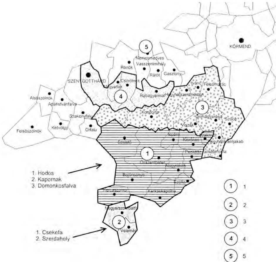
1. ábra Az Órség részei, határai és kiterjedése

Jelmagyarázat: 1 = A „történeti” Órség; az 1595-ös adománylevéliben felsorolt községek, illetve azok községegyesítés révén kialakított „jogutódai”; 2 = Belső-Órség; az adománylevéliben nem említett, de a helyi „köztudat” által az Órséghez sorolt községek; 3 = Külső-Órség; a középkor folyamán az őrtállóvidék része, de az 1595-ös adománylevél privilégiumot nyert községeinek sorából hiányozó falvak; 4 = a Rába-völgyben és a dombvidék határán fekvő községek, amelyeket egyes szerzők az Órséghez sorolnak; 5 = Nemesmedves és a Rába-parti dombvonulat, amelyet a természetföldrajzi tájbeosztás Felső-Órségnek nevez (társadalomtörténetileg nincs köze az Órséghez).