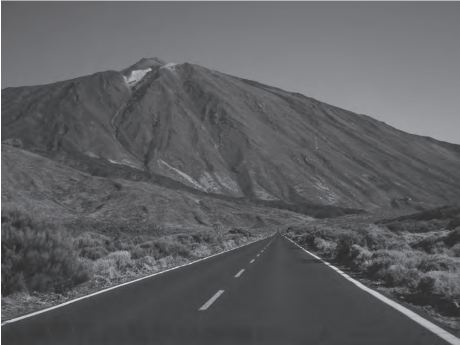
3. kép A legmagasabb vulkáni felépítmény, a Teide Photo 3 The highest volcanic edifice: Teide

óceánparton található a víz-magma robbanásos kölcsönhatásnak köszönhetően kialakuló tufagyűrűk, amelyek világszerte jelentős tudományos érdeklődésre tartanak számot (pl. CARMONA, J. et al. 2011). Tenerife legutolsó kitörése a hármás elágazás vonalának nyugati ágán, a Canadas kalderán kívül, a Chinyero vulkánmezőn következett be 1909-ben (2. ábra). Emellett számos egyéb történelmi kitörés ismert még Tenerifén (pl. 1704, 1705, 1706, 1798) (SCHMINCKE, H.U. 1976; CARRACEDO, J.C. et al. 1998).