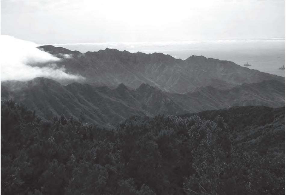
1. kép Mélyen erodált paleovulkáni táj Anagában Photo 1 Deeply eroded paleovolcanic landscape in Anaga

magával ragadják az utazót (1. kép). A Teno-vulkánt Los Gigantes sziklaóriásai képviselik kipreparálódott telérekkel, helyenként piroklasztit-rétegekkel (2. kép). A Roque del Conde vulkáni felépítménye kevés helyen bukkan elő a sziget déli területén, mivel nagyrészt elfedték a fiatalabb vulkáni üledékek. Idővel a kitörési központok fokozatosan közeledtek egymáshoz, majd a kisebb szigetek kb. 3,5 millió éve „összeolvadtak” (ANCOCHEA, E. et al. 1990). Ezután a kialakult sziget közepén már sekély magmakamrákból differenciáltabb magmák (fonolit, trachit) is felszínre törtek a bazaltok mellett (MARTÍ, J.–GUDMUNDSSON, A. 2000). E kitörések alakították ki a Las Canadas komplexumot, amely ma Tenerife legmagasabb, leglátványosabb régiója.