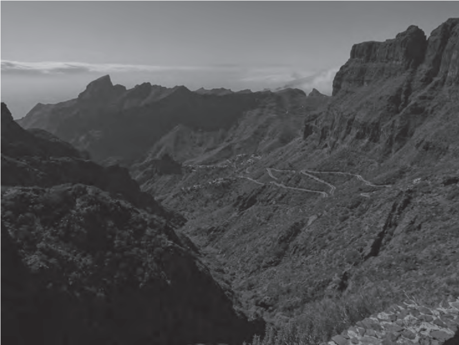
7. kép Masca hegyifalu a Los Gigantes sziklá között Photo 7 Masca mountain village surrounded by the rocks of Los Gigantes

csücskében lévő Anaga fantasztikus erdeivel és tájaival, valamint a keleti parton található Los Gigantes meredek sziklafalaival. A településföldrajz iránt érdeklődőknek is sok látnivalót rejt a sziget, ezek között említhetjük La Laguna történelmi városközpontját és magas státuszú lakónegyedeit, az északi part történelmi kisvárosait banánültetvényekkel, Güimar ősi piramisait, vagy Masca hegyi falut, ahonnan trekking út vezet a Los Gigantes sziklához (7. kép). Az óceán szerelmesei a sziget dél-keleti részén, Costa Adeje és Los Christianos közötti partvonal több kilométer hosszú homokos strandjain pihenhettek. Az állatvilág iránt érdeklődőknek kihagyhatatlan a tematikus programokat nyújtó Loro Park Puerto de la Cruzban.