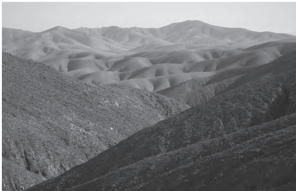
4. kép Fuerteventura mélyen lepusztult tája Photo 4 Deeply eroded landscape in Fuerteventura