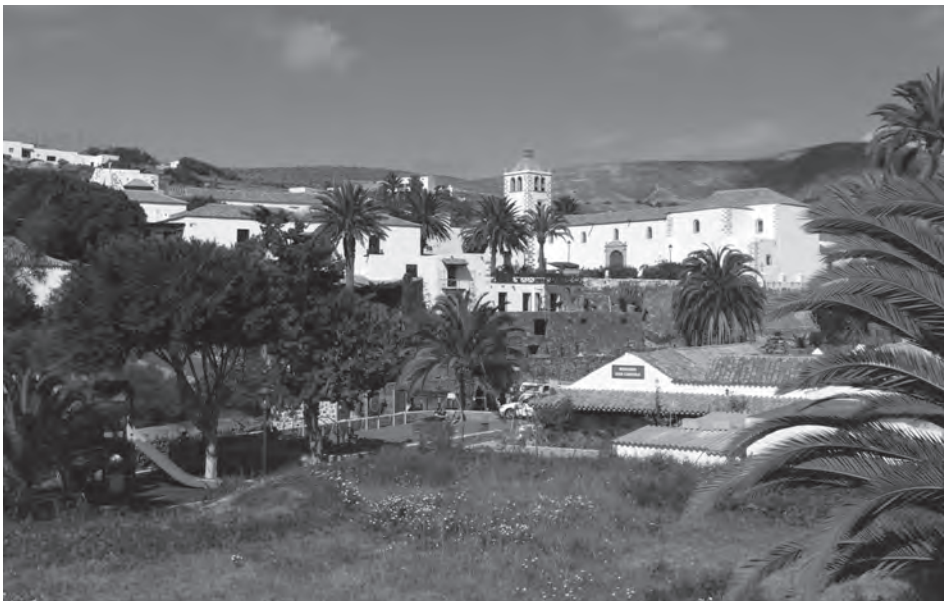
6. kép Az 1404-ben alapított Betancuria Photo 6 Betancuria founded in 1404

Fuerteventura őslakossága, a mauritániai berber rabszolgák leszármazottai, a mahorérok (majoreros) a sziget északi csücskén fekvő Maxorata királyságról kapták a nevüket. A 15. század elején, a spanyol hódítás kezdetén a kutatások szerint mintegy 1000 mahorérok élt még Fuerteventurán. A szigetet 1405-ben hódította meg a már említett Jean de Béthencourt konkvisztádor, ő alapította a sziget belsejében található Betancuria települést is, a turisták kedvelt célpontját (6. kép). A sziget történetének következő háromszáz évét a paraszti gazdaságok elterjedése határozta meg. A terméketlen, sokszor kietlen tájon a szamarak és tevék segítségével folyt a teraszos búza- és kukoricatermesztés, amely Fuerteventurát a Kanári-szigetek „magtárává” tette. A 18. században a szigetet a spanyolok által delegált ezredesek (Coroneles), a helyőrség parancsnokai irányították. Erődszerű főparancsnokságuk és lakóhelyük, a La Casa de los Coroneles La Oliva faluban mindmáig sok turistát vonz és kedvelt látogatóhely. A 19. század elejétől az ezredesek egyre inkább a spanyol államnak engedték át a hatalmat és 1912 után helyüket a félautonóm tanács (cabildo) vette át véglegesen, amelyet a fővárosból, Porto del Rosario-ból irányítottak.