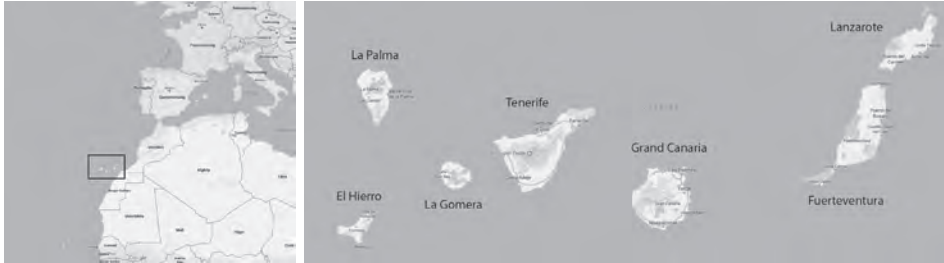
1. ábra A Kanári-szigetek fekvése Figure 1 Location of Canary Islands

A Kanári-szigeteket sokan az örök tavasz szigeteiként is emlegetik. Nem véletlen, hogy a szigetsorozat éghajlata a turizmus egyik legvonzóbb tényezője. A klíma egész évben kiegyensúlyozott, meleg, a térség földrajzi szélességéből adódó forró éghajlatot az óceáni hatások jelentősen mérséklék, a nagy hőingást kiegyenlítik. Az éghajlatot leginkább az északkeleti irányból érkező passzátszelek határozzák meg, melyek egész évben jellemzők. Téli időszakban erősebb ciklontevékenység is előfordul, amely instabilitást teremt és rossz időjárást okoz az egész szigetsorozat felett. Gyakori esemény az ún. „Calima” is, mely egy délről, néha keletről, a Szahara felől fújó forró, száraz szél. Hatására jelentős mennyiségű saharai homok kerül a levegőbe, és ez drasztikusan lecsökkenti a látótávolságot a szigetsorozaton. A szeleken kívül meghatározó még az északról érkező, hideg Kanári-áramlat, mely a szigetsorozathoz környezeténél hűvösebb tengervizet szállít, és nagyban befolyásolja a párolgási folyamatokat (FERNANDOPULLÉ, D. 1976).