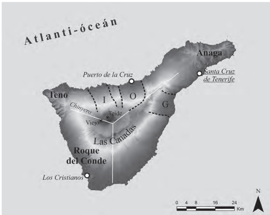
2. ábra Tenerife domborzatmodellén (magyarázat a szövegben) Figure 2 Tenerife on digital elevation model (explanation in text)

Tenerife kialakulásának kezdeti szakaszával kapcsolatban nagyrészt konszenzus van a kutatók között. A jelenlegi pajzsvulkán-építő szakasz korai, de már nem tenger alatti időszakában (kb. 7,5 millió éve) három különálló vulkán működött itt (ANCOCHEA, E. et al. 1990). Ezek kőzetanyaga (melyet a szakirodalomban „Old Basaltic Series-nek”, azaz Idős Bazalt Sorozatnak neveznek) ma a sziget három „sarkán” bukkan elő: Anaga, Teno és Roque del Conde területeken (2. ábra) (HUERTAS, M. et al. 2002). E három vulkáni központ (melyeket a mai előbukkanási területekhez hasonlóan Anaga-, Teno- és Roque del Conde-ősvulkánoknak neveznek) a miocén korban kezdte meg víz feletti működését elsősorban alacsony SiO 2 tartalmú bazaltos magmákat felszínre hozva, majd főként kisebb pajzsvulkáni jellegű szerkezeteket felépítve. E szakasznak a képződményeit a sziget fentebb említett területein vizsgálhatjuk. Anaga Tenerife egyik legkülönlegesebb területe: mélyen lepusztult vulkán, amelynek köderdői, egzotikus hangulata és nagy relatív szintkülönbségei