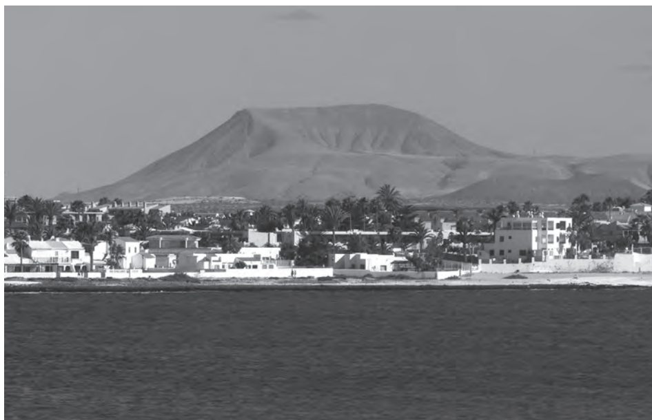
5. kép Fiatal salakkúp Fuerteventurán, mint a poszt-eróziós vulkanizmus bizonyítéka. Photo 5 Young scoria cone in Fuerteventura: evidence of the post-erosional volcanism.

A legutóbbi kitörés ugyan bő 100 éve történt, a sziget mégis nyugtalan, több kisebb föld-rengés pattant ki az elmúlt években (SÁNCHEZ-ALZOLA, A. et al. 2016), ami utal a felszín