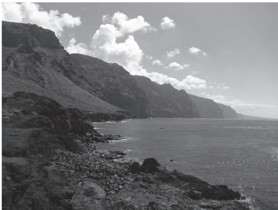
2. kép A Los Gigantes sziklafala Teno felől Photo 2 Rocks of Los Gigantes from Teno

robbanásos kitérést produkált Tenerifén nagy mennyiségű magma felszínre hozásával, így a fonolitos kitérések után a magmakamrában anyagihiány léphetett fel. A vulkán teteje emiatt megsüllyedhetett, ily módon kialakítva a kalderát. Eközben többszöri nagyméretű csuszamlások formálták tovább a kaldera peremét, amelyek rendszeresen „elvitték” a kaldera egy részét egyfajta „megacunamit” idézve elő (CANTAGREL, J. et al. 1999; PARIS, R. et al. 2017). E hegyoldal-csuszamlások nyomai törmelék formájában az óceán fenekén ma is megtalálhatók (ABLAY, G. – HÜRLIMANN, M. 2000). Ez a ciklus (kalderaformáló kitérés és óriási csuszamlások) többször lejátszódott Tenerife fejlődéstörténete során. A legutóbbi csuszamlások nyomait őrzik a nagyméretű, széles és mély völgyek (Icod és La Orotava völgyek), emellett az idősebb Güímar-völgyet is csuszamlásos eredetűnek rekonstruálták (2. ábrán I (Icod), O (Orotava) és G (Güímar) betűk jelölik a csuszamlásos völgyeket) (CANTAGREL, J.M. et al. 1999). A kalderaképző kitérések között voltak kisebb volumenű vulkánkitérések is, melyek egyszerű, bazaltos magmát hoztak a felszínre. Ezekben az időszakokban a kalderában új rétegvulkáni kúp épülhetett fel. Ilyen stádiumban van jelenleg Tenerife Canadas-komplexuma, melynek közepén tornyosul a felújult vulkánosság bizonyítéka, a 3718 méter magas központi csúcs, a Teide (3. kép), valamint az alacsonyabb Viejo kráter (MARTÍ, J. – GUDMUNDSSON, A. 2000).