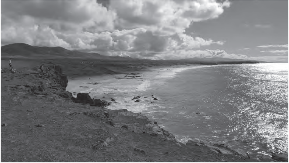
8. kép El Cotillo gigantikus partvonala Fuerteventurán Photo 8 The gigantic coast line of El Cotillo in Fuerteventura